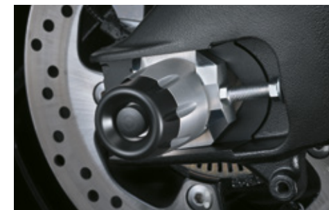
Achsprotector, hinten 64790-48810-000 Der Protektor mindert Sturzschäden, gefertigt aus Aluminium und POM (Polyacetal).