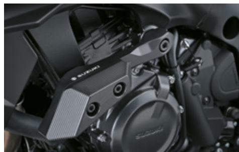
Frame Slider Set 41900-48810-000 Der Protektor mindert Sturzschäden, gefertigt aus Aluminium und POM (Polyacetal).