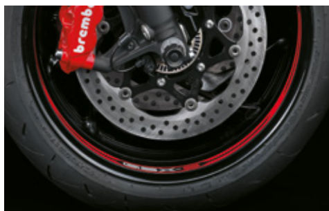
Felgenbettdekor rot 99182-48K11-RED Dekorset zur Individualisierung des Felgenbetts. *Set mit 6 Aufklebern pro Rad. Geeignet für Vorder- und Hinterrad. Mit GSX-S1000GX Logo.