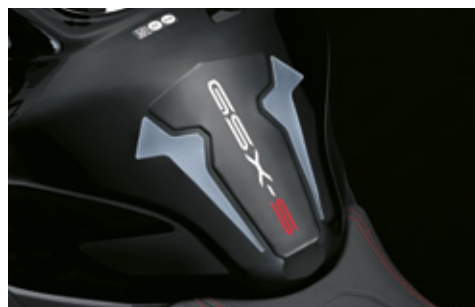
Tankpad 99180-48K11-GRY Schützt vor Kratzern im Lack, mit GSX-S-Logo.