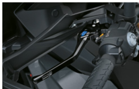
Aluminium-Kupplungshebel (eloxiert) 57600-48810-000 Gefertigt aus hochwertigem Billet-Aluminium, verziert mit GSX-S Logo (vorne) und Suzuki "S" Logo. Diese schwarz eloxierten Hebel sorgen für einen noch sportlicheren Look. Auslieferung mit je zwei Hebelverstellern in Blau und Rot, die wahlweise verwendet werden können.