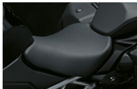
Niedriger Fahrersitz 45100-48K10-B8Q Sitzhöhe 15 mm niedriger als Standard.