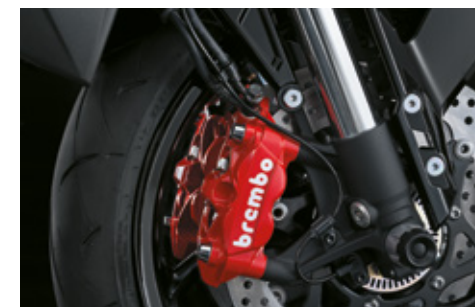
Farbige Brembo Bremssättel 59100-17800-000 Gemeinsam mit Brembo entwickelte Hochleistungs-Bremssättel. Farbe: Rot