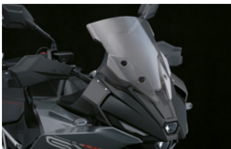
Sport-Scheibe, getönt 94601-48820-000 55 mm kürzer als die Standard-Scheibe. Dunkle Tönung und ein sehr sportlicher Look.