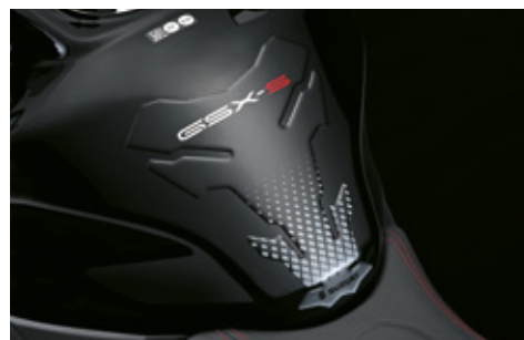
Tankpad 99180-48K21-BLK Schützt vor Kratzern im Lack, mit GSX-S-Logo.