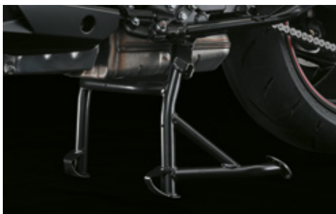
Hauptständer 42100-48830-000 Verleiht einen sicheren Stand beim Parken sowie bei Wartungsarbeiten.