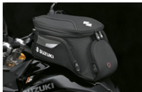
Tankrucksack (groß)* 99143-00A01-000 Strapazierfähiges Nylonmaterial mit reflektierenden Applikationen, Volumen 11 Liter, erweiterbar auf 15 Liter, inklusive Regenhülle und Schultergurt. *Benötigt wird Ringbefestigung für Tankrucksack (p/n 44200-25810-000). Maximale Zuladung: 2,5 kg. Bei Nutzung des Tankrucksacks bitte nicht schneller als 130 km/h fahren.