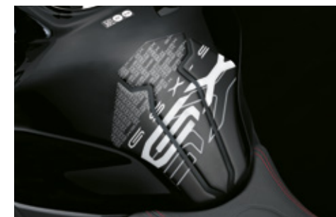
Tankpad 99180-48K30-SGX Schützt vor Kratzern im Lack, mit GSX-S-Logo.