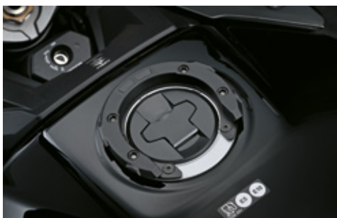
Ringbefestigung für Tankrucksack 44200-25810-000 Wird benötigt zur Befestigung des Tankrucksacks (p/n 99143-00A01-000 / 99143-00A11-000).