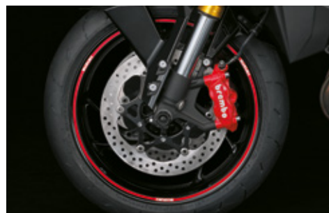
Felgenranddekor rot 99183-00A21-RD1 Dekorset zur Individualisierung des Felgenrandes. *Set mit 6 Aufklebern pro Rad. Geeignet für Vorder- und Hinterrad. Rotes Dekor mit Suzuki Logo.