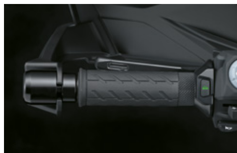
Griffheizung 57100-48822-000 Bietet drei verschiedene Heizstufen. Die gesamte Oberfläche wird beheizt.