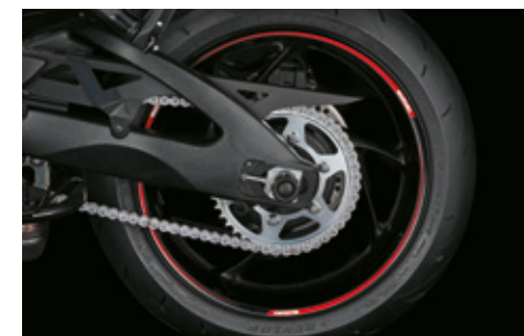
Felgenranddekor rot/schwarz 99183-00A11-RD1 Dekorset zur Individualisierung des Felgenrandes. *Set mit 6 Aufklebern pro Rad. Geeignet für Vorder- und Hinterrad. Rot/schwarzes Dekor mit Suzuki Logo.