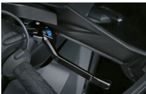
Aluminium-Bremshebel (eloxiert) 57400-48810-000 Gefertigt aus hochwertigem Billet-Aluminium, verziert mit GSX-S Logo (vorne) und Suzuki "S" Logo. Diese schwarz eloxierten Hebel sorgen für einen noch sportlicheren Look. Auslieferung mit je zwei Hebelverstellern in Blau und Rot, die wahlweise verwendet werden können.