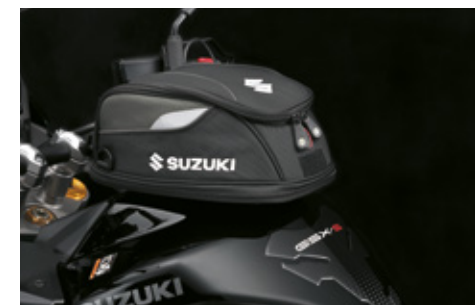
Tankrucksack (klein)* 99143-00A11-000 Strapazierfähiges Nylonmaterial mit reflektierenden Applikationen, Volumen 5 Liter erweiterbar auf 9 Liter, inklusive Regenhülle und Schultergurt. *Benötigt wird Ringbefestigung für Tankrucksack (p/n 44200-25810-000). Maximale Zuladung: 2,5 kg. Bei Nutzung des Tankrucksacks bitte nicht schneller als 130 km/h fahren.