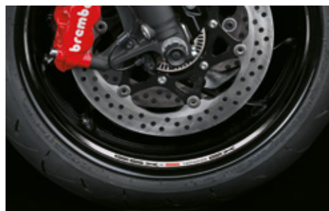
Felgenbettdekor weiß 99182-48K20-SGX Dekorset zur Individualisierung des Felgenbetts. *Set mit 6 Aufklebern pro Rad. Geeignet für Vorder- und Hinterrad. Mit GSX-S1000GX Logo.