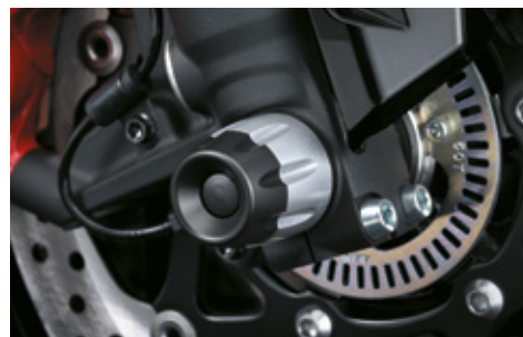
Achsprotector, vorne 54790-48810-000 Der Protektor mindert Sturzschäden, gefertigt aus Aluminium und POM (Polyacetal).