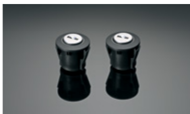
Schlosssatz Kunststoffkoffer 95700-48810-000 In Kombination mit Kunststoff-Topcase 35 L (p/n 93300-25810-000) und Kunststoff-Seitenkoffer (p/n 95400-25810-000). 2 Sätze (p/n 95700-48810-000) 1 Satz (p/n 95700-48820-000)