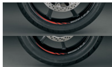
Felgenreanddekor (rot) 99183-25L00-RED Farbiges Highlight für die Felgen 99183-25L10-RED mit V-Strom-Logo. Satz von 4 Aufklebern pro Rad.

*Der Artikel kann sowohl vorne (99183-25L00-RED) als auch hinten (99183-25L10-RED) verwendet werden. Wichtig: Das Set muss pro Rad bestellt werden.