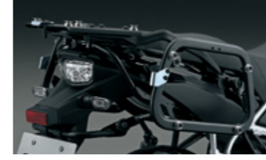
Seitenkofferträger 93700-25860-000 Erforderlich für die Montage des Aluminium-Seitenkoffersatzes (p/n 95400-25840-000/95400-25870-000).