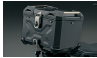
Aluminium-Topcase 38 L 93100-25860-000 Das Aluminium-Topcase mit geprägtem Suzuki Logo ist immer die richtige Wahl. In Kombination mit Trägerplatte (p/n 93800-25850-000), 2 Schlösser erforderlich (p/n 95700-25810-000). Zwei Farben verfügbar: Silber: Eloxiiert / Schwarz: Pulverbeschichtet