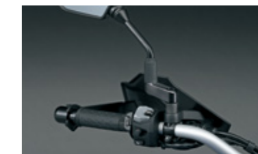
Spiegelverbreiterung 56700-25820-000 Ermöglicht die Spiegel nach den eigenen Wünschen in der Höhe (50 mm) und in der Breite (40 mm) im Vergleich zur Serie anzupassen. *Das Set beinhaltet die Adapter für beide Spiegel. Erforderliche Distanzstücke für die Montage (p/n 56000-25810-000).