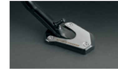
Seitenständer-Verbreiterungsplatte 42300-25830-000 Erhöht die Stabilität beim Parken und sorgt für einen ausgefallenen Look mit V-Strom-Logo.