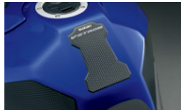
Tankpad 99180-25L11-000 Zum Schutz des Tanks vor Kratzern, mit V-Strom-Logo.