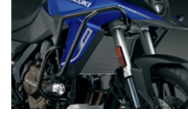
Sturzbügel 94200-25810-000 Verleiht der V-Strom einen einzigartigen Touring-Look und schützt die Verkleidung. Für die Montage wird der Rahmenunterzug (p/n 41100-25810-000) benötigt. Erforderlich für die Installation von den LED-Nebelscheinwerfern (p/n 99172-25L00-000).