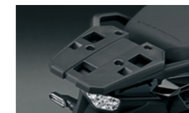
Adapterplatte für Top-Case 35 L 93900-25820-000 Das Topcase-Trägerset ist nur für die Montage des Kunststoff-Topcase 35 L (p/n 93300-25810-000) vorgesehen. Nicht für andere Zwecke verwenden.