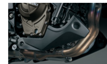
Bugspoiler 94400-25820-000 Zusätzliche Option für einen sportlichen Look. Nicht in Kombination mit dem Rahmenunterzug (p/n 41100-25810-000) möglich.