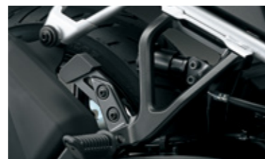
Seitenkoffer, untere Halterung 93700-25880-000 Erforderlich für die Montage des Kunststoff-Seitenkoffer-Sets (p/n 95400-25810-000). In Kombination mit oberer Halterung (p/n 47500-25810-000).