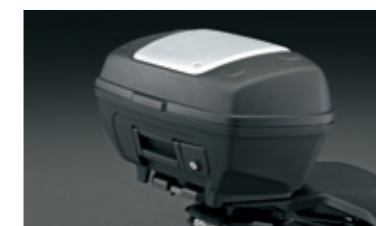
Kunststoff-Topcase 35 L 93300-25810-000 Maximale Beladung 5 kg, Kofferkapazität 35 L. Bitte verwende diesen Artikel nur bei Geschwindigkeiten von weniger als 130 km/h. In Kombination mit Trägerplatte (p/n 93900-25820-000) und Schloss-Set (p/n 95700-48810-000/95700-48820-000).