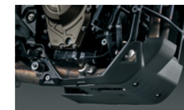
Abdeckung 94400-25830-000 Zusätzliche Option zum Schutz des Motors. In Kombination mit Rahmenunterzug (p/n 41100-25810-000).