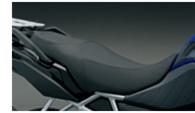
Hoher Sitz 45100-25L00-CKA Für Fahrer, die eine größere Sitzhöhe wünschen, ersetzt dieses Zubehörteil den Originalsitz durch einen 30 mm höheren Sitz.