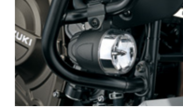
LED-Nebelscheinwerfer-Set 99172-25L00-000 Helle LED-Nebelscheinwerfer, fest verschraubt mit dem Zubehörbügel. Das Set beinhaltet die rechte und linke Lampe. In Kombination mit Zubehörbügel (p/n 94200-25810-000) und Rahmenunterzug (p/n 41100-25810-000).