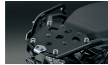
Topcase-Trägerplatte 93800-25850-000 Das Topcase-Trägerset ist nur für die Montage des Aluminium-Topcase (p/n 93100-25840-000/93100-25860-000) vorgesehen. Nicht für andere Zwecke verwenden.