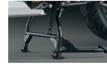
Hauptständer 42100-25820-000 Bringt das Bike in eine sichere und stabile Standposition für Wartungsarbeiten.