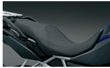
Niedriger Sitz 45100-25L00-CKA Für Fahrer, die eine niedrigere Sitzhöhe wünschen, ersetzt dieses Zubehörteil den Originalsitz durch einen 20 mm niedrigeren Sitz.