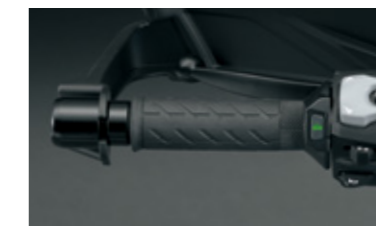
Griffheizung 57100-25820-000 Mit 3 Heizstufen, modellspezifischem Kabelbaum und wasserdichten Steckverbindungen. Interne Steuerung vermeidet unnötigen Batterieverbrauch.