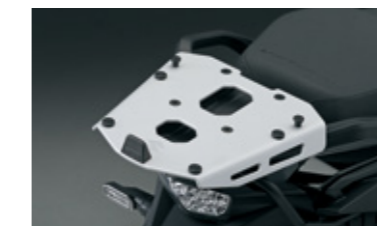
Adapterplatte für Top-Case 56 L 93800-25870-000 Das Topcase-Trägerset ist nur für die Montage des Kunststoff-Topcase 56 L (p/n 93100-25810-000) vorgesehen. Nicht für andere Zwecke verwenden.