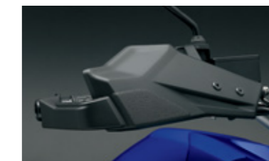
Handprotektoren 57300-25810-000 Hilft, die Hände vor Wind zu schützen. Ermöglicht die Spiegel nach den eigenen Wünschen in der Höhe (50 mm) und in der Breite (40 mm) im Vergleich zur Serie anzupassen. sind zusätzlich die Distanzstücke (p/n 56000-25810-000) erforderlich.