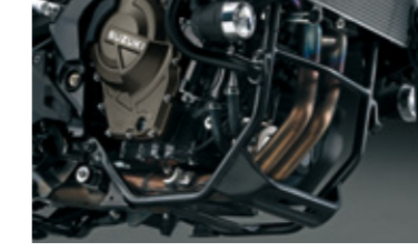
Rahmenunterzug 41100-25810-000 Erforderlich für die Montage des Sturzbügel (94200-25810-000), Aluminium Unterfahrschutz (p/n 42500-25830-000) oder der Abdeckung (p/n 94400-25830-000).