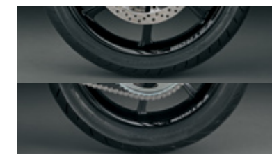
Felgenreanddekor (grau) 99183-25L00-GRY Farbiges Highlight für die Felgen 99183-25L10-GRY mit V-Strom-Logo. Satz von 4 Aufklebern pro Rad.

*Der Artikel kann sowohl vorne (99183-25L00-RED) als auch hinten (99183-25L10-RED) verwendet werden. Wichtig: Das Set muss pro Rad bestellt werden.