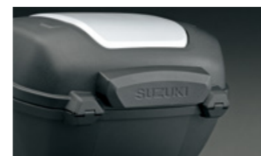
Rückenpolster für Kunststoff-Topcase 35 L 99146-31100-35L Verbessert den Fahrkomfort für den Beifahrer. Zur Montage am Kunststoff-Topcase 35 L (p/n 93300-25810-000).