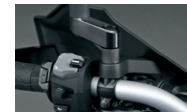
Distanzstücke für Spiegelverbreiterung 56000-25810-000 In Kombination mit der Spiegelverbreiterung (p/n 56700-25820-000).