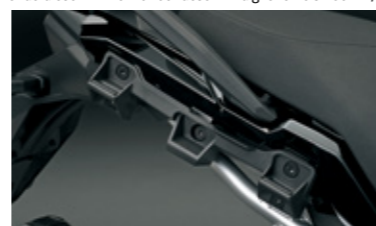
Seitenkoffer, obere Halterung 47500-25810-000 Erforderlich für die Montage des Kunststoff-Seitenkoffer-Sets (p/n 95400-25810-000). In Kombination mit unterer Halterung (p/n 93700-25880-000).