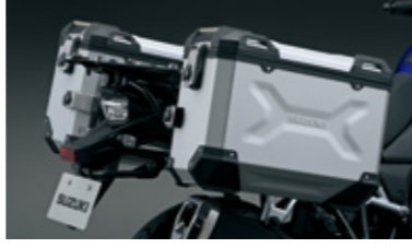
Aluminium-Seitenkoffer-Set 95400-25840-000 Seitenkoffer aus Aluminium mit geprägtem Suzuki Logo sind immer die erste Wahl für die V-Strom. In Kombination mit Seitenkofferträger (p/n 93700-25860-000), Schlosssatz (p/n 95700-25830-000) und Spiegelverbreiterung (p/n 56700-25820-000) zu verwenden. Zwei Farben verfügbar: Silber: Eloxiiert / Schwarz: Pulverbeschichtet.