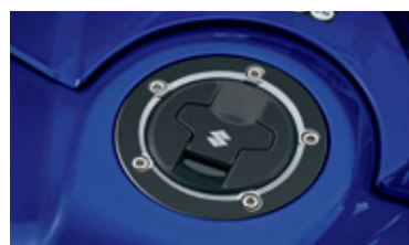
Schutzaufkleber für Tankdeckel 99185-00A00-BLK Schutz vor Kratzern auf dem Tankdeckel. Schwarzes Design, Carbon-Design ist ebenfalls erhältlich (p/n 99185-00A00-CRB).