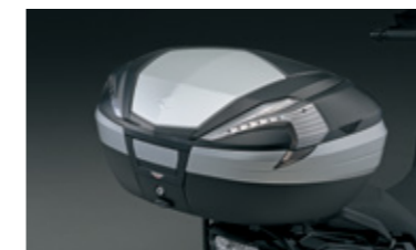
Kunststoff-Topcase 56 L 93100-25810-000 Großes Kunststoff-Topcase. Inklusive Schloss und Schlüssel. Kann nicht mit Seitenkoffer-Set verwendet werden (p/n 95400-25810-000). *Maximale Beladung 3 kg und Kofferinhalt 56 L. Nur bei Geschwindigkeiten von weniger als 130 km/h verwenden. In Kombination mit Trägerplatte (p/n 93800-25870-000).