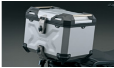
Aluminium-Topcase 38 L 93100-25840-000 Das Aluminium-Topcase mit geprägtem Suzuki Logo ist immer die richtige Wahl. In Kombination mit Trägerplatte (p/n 93800-25850-000), 2 Schlösser erforderlich (p/n 95700-25810-000). Zwei Farben verfügbar: Silber: Eloxiiert / Schwarz: Pulverbeschichtet