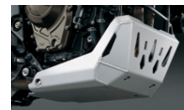
Aluminium Unterfahrschutz (silber) 42500-25830-000 Aluminium Unterfahrschutz im robusten Look. In Kombination mit Rahmenunterzug (p/n 41100-25810-000).