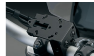
Navihalter 99155-00A00-000 Der vibrationsgedämpfte Halter kann in der Mitte des Lenkers montiert werden, sodass bspw. ein Navi daran befestigt werden kann.