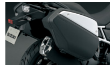
Seitenkoffer-Set aus Kunststoff 95400-25810-000 Maximale Zuladung jeweils 5 kg und Kofferkapazität 26 L (rechts) und 29 L (links). Nur bei Geschwindigkeiten bis 130 km/h verwenden. In Kombination mit Halterung (p/n 47500-25810-000/93700-25880-000) und Schloss-Set (p/n 95700-48810-000/95700-48820-000).