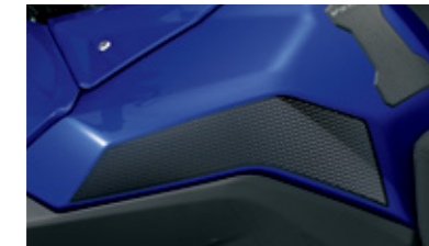
Tankschutzfolie 99181-25L11-000 Schützt den Lack vor Kratzern.