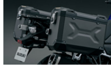
Aluminium-Seitenkoffer-Set 95400-25870-000 Seitenkoffer aus Aluminium mit geprägtem Suzuki Logo sind immer die erste Wahl für die V-Strom. In Kombination mit Seitenkofferträger (p/n 93700-25860-000), Schlosssatz (p/n 95700-25830-000) und Spiegelverbreiterung (p/n 56700-25820-000) zu verwenden. Zwei Farben verfügbar: Silber: Eloxiiert / Schwarz: Pulverbeschichtet.