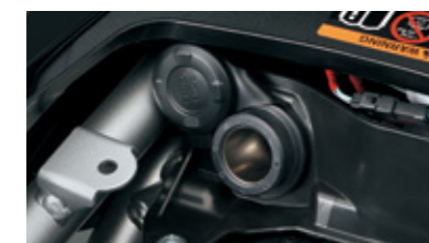
12 V-Steckdose 38800-31810-000 Bietet die Möglichkeit, elektrische Geräte zu verwenden. Wird unter dem Sitz installiert.