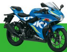
z.B. GSX-R125 ABS

Gültig für Fahrzeuge bis 125cm 3 , 11kW(15PS) / 0,1 kW/kg