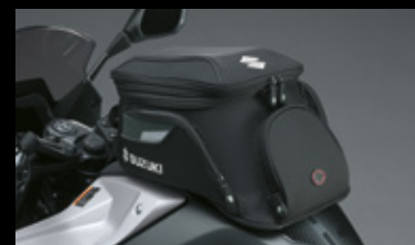
Tankrucksack (groß)* 99143-00A01-000 Strapazierfähiges Nylonmaterial mit reflektierenden Applikationen, Volumen 11 Liter, erweiterbar auf 15 Liter, inklusive Regenhülle und Schultergurt. *Benötigt wird Ringbefestigung für Tankrucksack (p/n 44200-25810-000). Maximale Zuladung: 2,5 kg. Bei Nutzung des Tankrucksacks bitte nicht schneller als 130 km/h fahren.