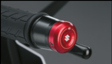
Lenkerendgewichte (Rot) 56200-25890-000 Gefertigt aus Stahl und Aluminium; mit Suzuki "S" Logo. Satz für rechte und linke Seite.