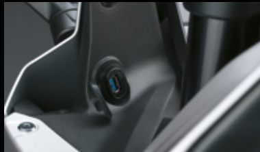
USB-Steckdose 39100-25820-000 Kompakte USB-Steckdose zum Aufladen elektronischer Geräte. Eine Abdeckung schützt vor Staub, Sand usw. USB Typ-A mit 5V/2A Ausgang.