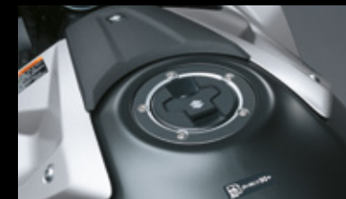
Tankdeckelschutz 99185-00A00-BLK Verhindert Kratzer auf dem Tankdeckel. Markantes schwarz genarbttes Design. Nicht zu verwenden mit Ringbefestigung für Tankrucksack (p/n 44200-25810-000).