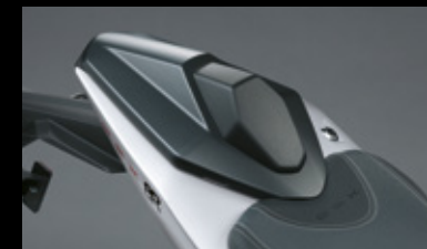
Soziusabdeckung 45500-25800-000 Unterstreicht den sportlichen Look deiner GSX-8R.