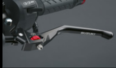
Aluminium-Kupplungshebel (eloxiert) 57620-25830-000