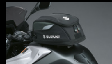
Tankrucksack (klein)* 99143-00A11-000 Strapazierfähiges Nylonmaterial mit reflektierenden Applikationen, Volumen 5 Liter, erweiterbar auf 9 Liter, inklusive Regenhülle und Schultergurt. *Benötigt wird Ringbefestigung für Tankrucksack (p/n 44200-25810-000). Maximale Zuladung: 2,5 kg. Bei Nutzung des Tankrucksacks bitte nicht schneller als 130 km/h fahren.