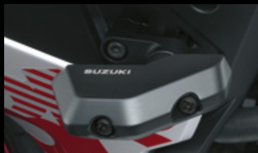
Frame Slider Set 41900-25850-000 Die Slider auf beiden Fahrzeugseiten sind durch eine Stange miteinander verbunden, was der Konstruktion höchste Festigkeit verleiht und die Schutzwirkung bei einem Sturz maximiert. Mit Suzuki Logo, Satz für rechte und linke Seite.