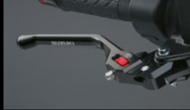
Aluminium-Bremshebel (eloxiert) 57400-25830-000 Gefräst aus hochwertigem Billet-Aluminium, verziert mit Suzuki Logo (vorne) und "S" Logo. Diese schwarz eloxierten Hebel sorgen für einen noch sportlicheren Look. Auslieferung mit je zwei Hebelverstellern in Blau und Rot, die wahlweise verwendet werden können.