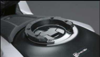
Ringbefestigung für Tankrucksack 44200-25810-000 Zur Befestigung des Tankrucksacks (p/n 99143-00A01-000 oder 99143-00A11-000).