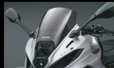
Touring-Scheibe (rauchgetönt) 94600-25840-000 Dunkle Tönung für einen stilvollen Look, dazu 27 mm höher für einen besseren Windschutz.