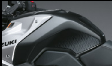
Tankschutzfolie 99181-25L01-000 Diese Folien schützen den Tank beidseitig vor Kratzern. Die Schwarz- und Grautöne harmonisieren mit dem Tankpad. Satz für rechte und linke Seite.