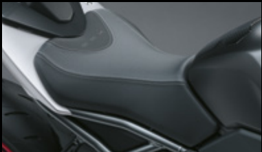
Stilvoller Fahrersitz 45100-25L10-CPF Der stilvolle, zweifarbige Sitz mit geprägtem GSX-Logo verleiht dem Motorrad einen edlen Touch.