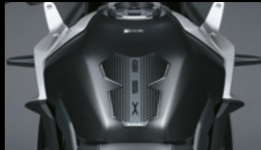
Tankpad 99180-25L01-000 Schützt vor Kratzern im Lack, mit GSX-Logo.