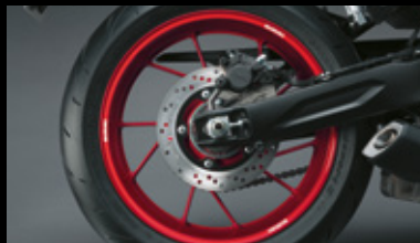
Felgenranddekor 99183-00A21-RD1 Dekorset zur Individualisierung des Felgenrandes. *Set mit 6 Aufklebern pro Rad. Geeignet für Vorder- und Hinterrad. Rotes Dekor mit Suzuki Logo.