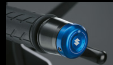
Lenkerendgewichte (Blau) 56200-25870-000 Gefertigt aus Stahl und Aluminium; mit Suzuki "S" Logo. Satz für rechte und linke Seite.