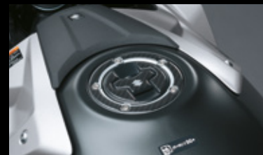
Tankdeckelschutz 99185-00A00-CRB Verhindert Kratzer auf dem Tankdeckel. Im sportlichen Carbon-Look. Nicht zu verwenden mit Ringbefestigung für Tankrucksack (p/n 44200-25810-000).