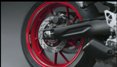
Felgenbettdekor 99182-00A01-SZK Dekorset zur Individualisierung des Felgenbetts. *Set mit 6 Aufklebern pro Rad. Geeignet für Vorder- und Hinterrad. Mit Suzuki Logo.